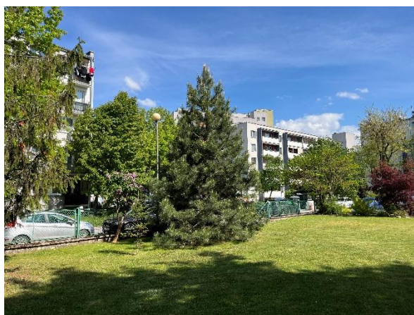
Ryc. 6-9. Zieleń istniejąca na terenie placu zabaw przy Żłobku Miejskim Od strony zachodniej, w części centralnej oraz od strony wschodniej.