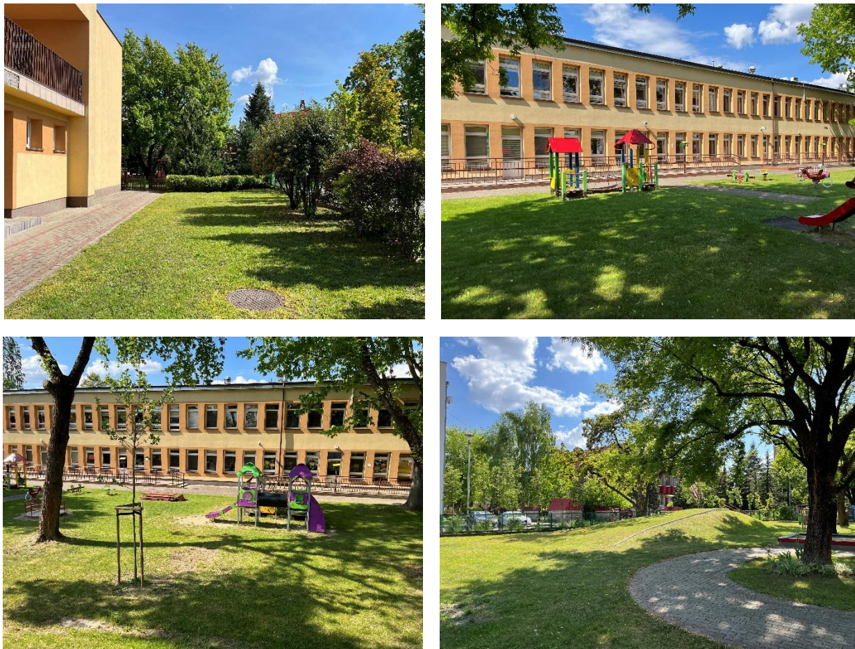
Ryc.2-5. Teren objęty opracowaniem przy Żłobku Miejskim.