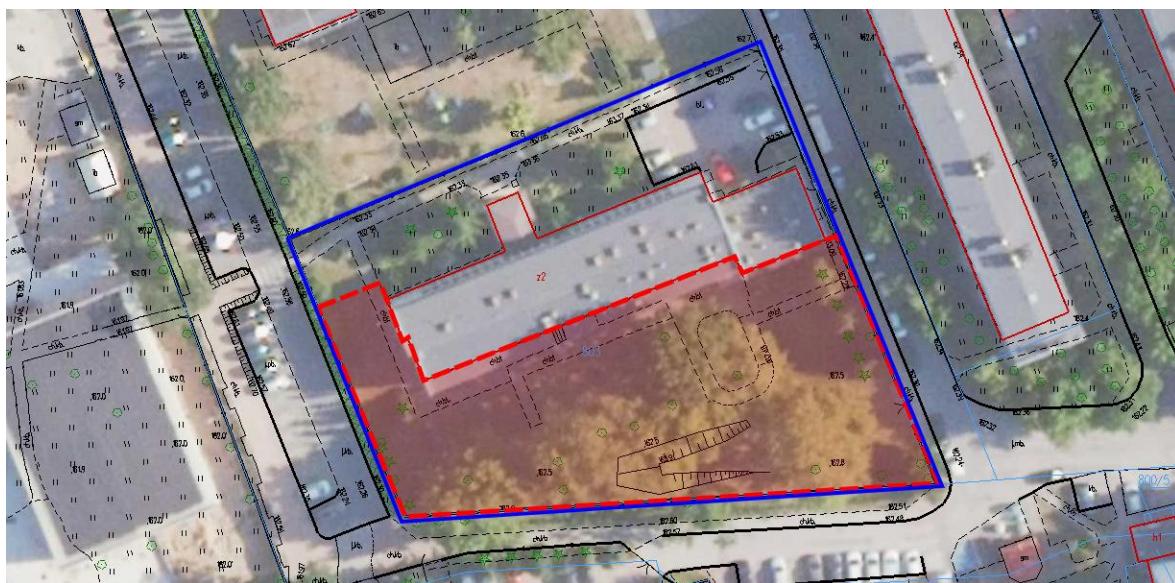
Ryc.1. Zakres działki Żłobka Miejskiego w Stalowej Woli — / Teren objęty opracowaniem —